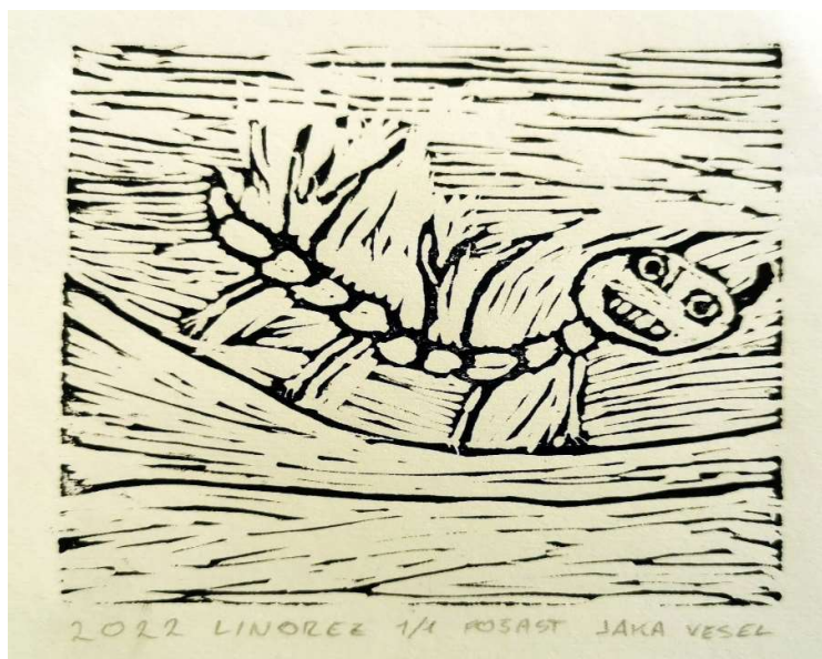
Slika 3: Jaka Vesel, 7. razred