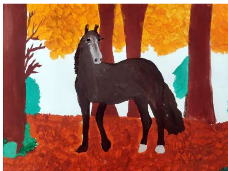
Slika 8: Žana Košmerl, 9. razred