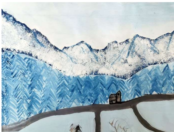
Slika 10: Maša Kordiš, 9. razred