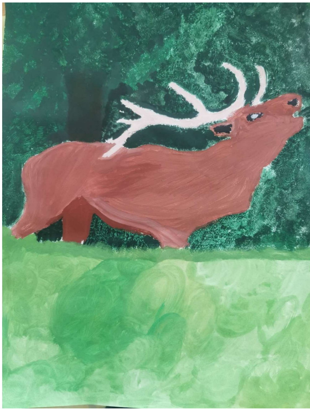
Slika 5: Lovrenc Levstik, 9. razred