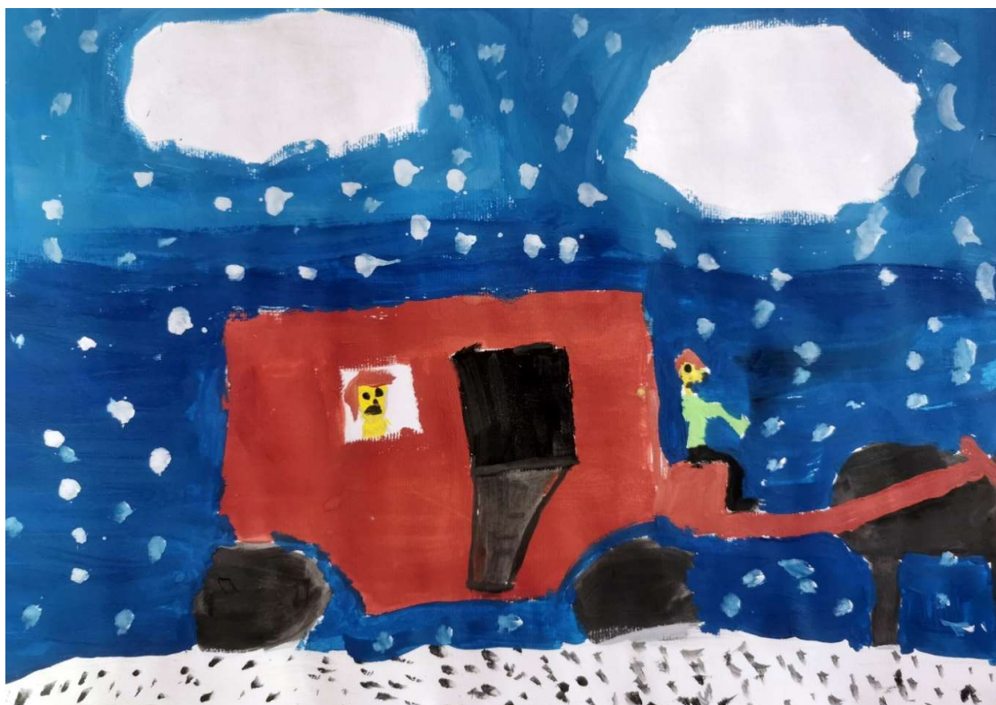
Slika 4: Žan Lavrič, 7. razred