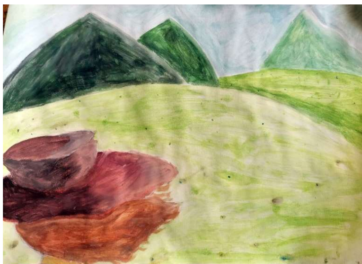
Slika 13: Lada Pivovarova, 7. razred