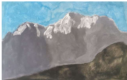
Slika 9: Nik Cimprič, 9. razred